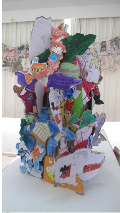
Στάδιο δημιουργίας της εικαστικής εγκατάστασης