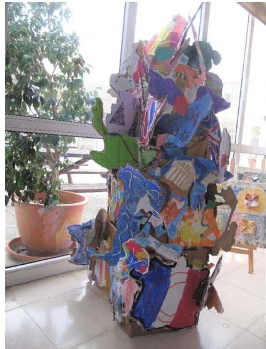
Η τελική εικαστική εγκατάσταση