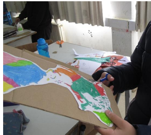
Παιδιά εργάζονται και δημιουργούν